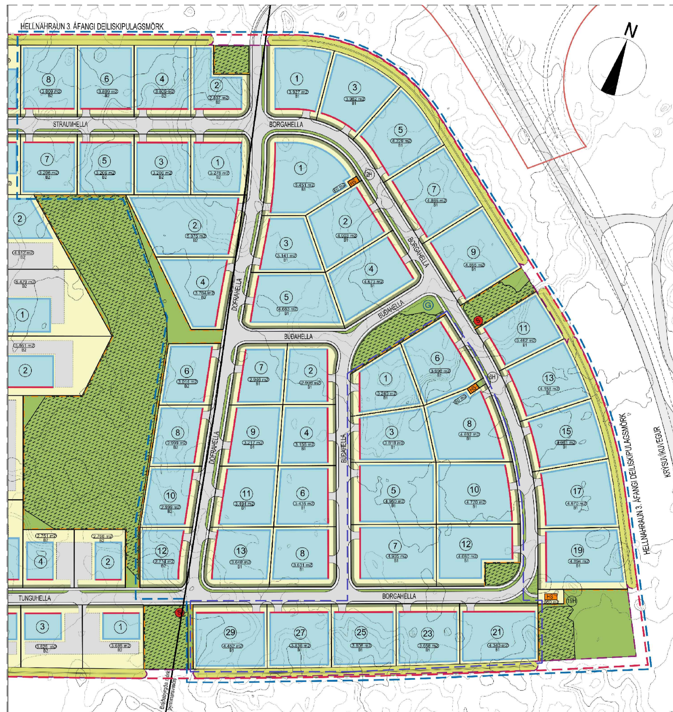
Fyrir breytingu - í gildi frá 27. mars 2020 mkv. 1:2000